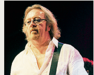
Umberto Tozzi.

ROMA. Guai per Umberto Tozzi. Il cantautore è stato condannato a otto mesi di carcere (pena sospesa) dalla Corte d'Appello di Roma per un'evasione fiscale da 800mila euro accumulata tra il 2002 e il 2005. Il cambio di residenza del