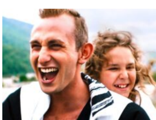
Ecco Castellinaria 2020