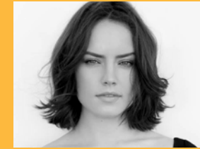
Daisy Ridley Executive Producer